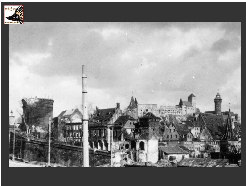
Die Burg, links der Neutorturm