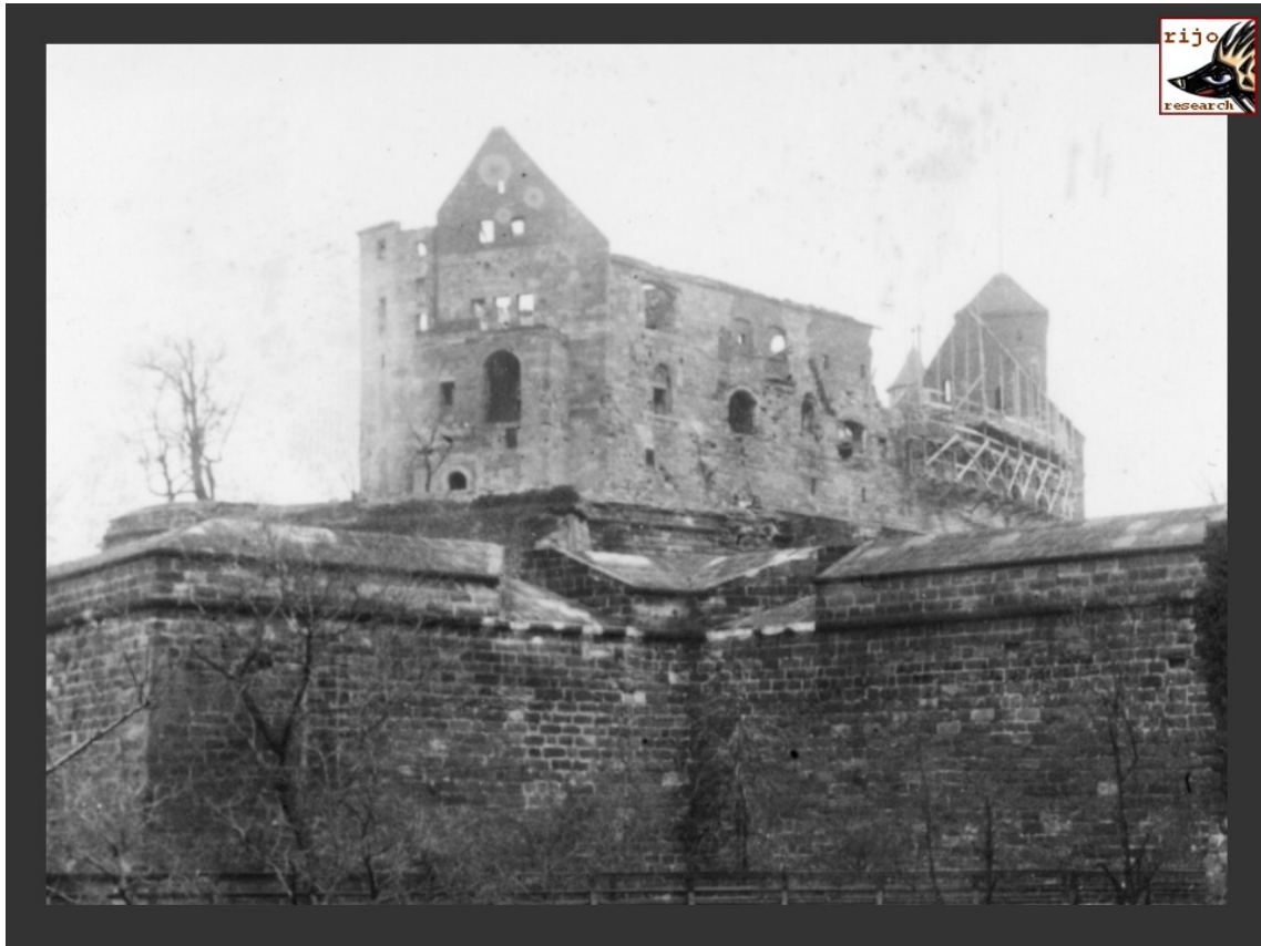
Der Pallas der Kaiserburg