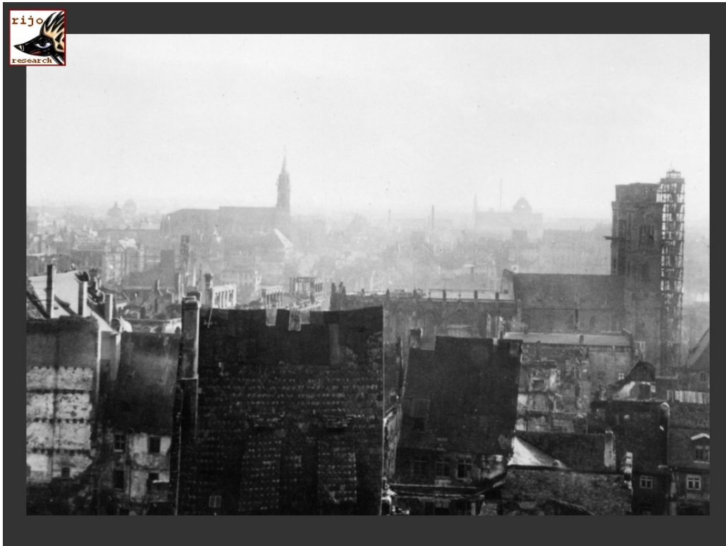
Panorama von der Burgfreieung mit St. Sebald im Vordergrund, dahinter St. Lorenz