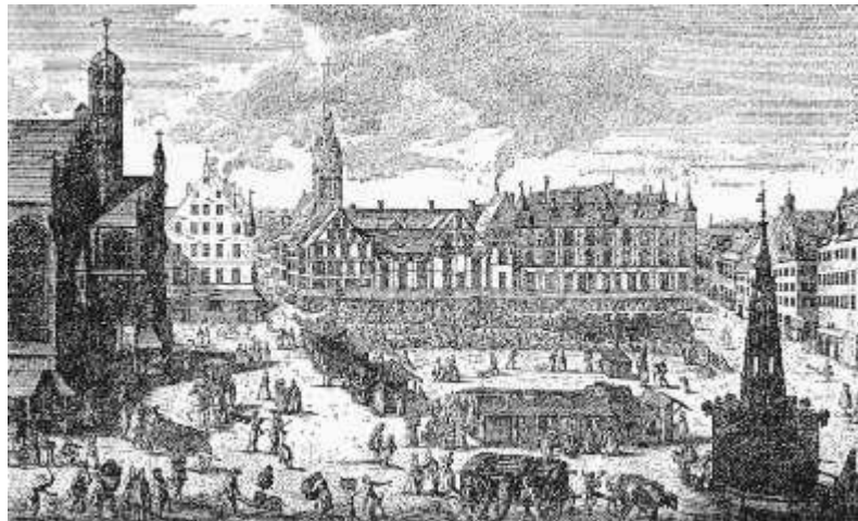
Der Nürnberger Hauptmarkt im frühen 18. Jahrhundert: links die Frauenkirche, errichtet auf dem Platz der ersten Nürnberger Synagoge (Kupferstich von Johann Adam Delsenbach)