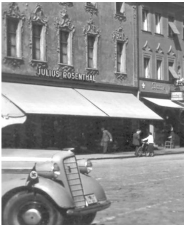
Vergrößerung aus obiger Postkarte: Im Hintergrund das Bekleidungsgeschäft Julius Rosenthal am Ludwigsplatz, im Vordergrund Auto mit Hakenkreuzfähnchen