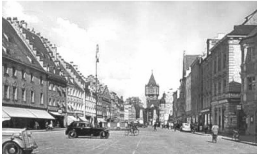
Postkarte vom Straubinger Ludwigsplatz, entstanden Mitte der dreißiger Jahre