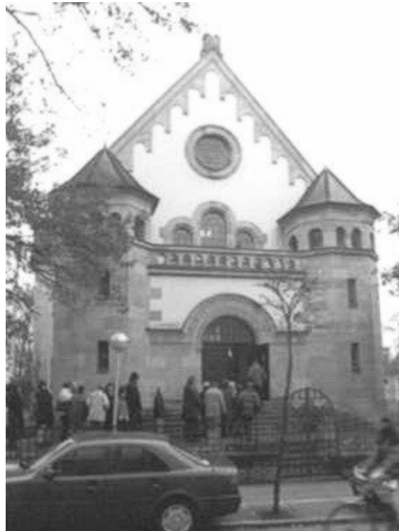
Die Synagoge in Straubing (2001)