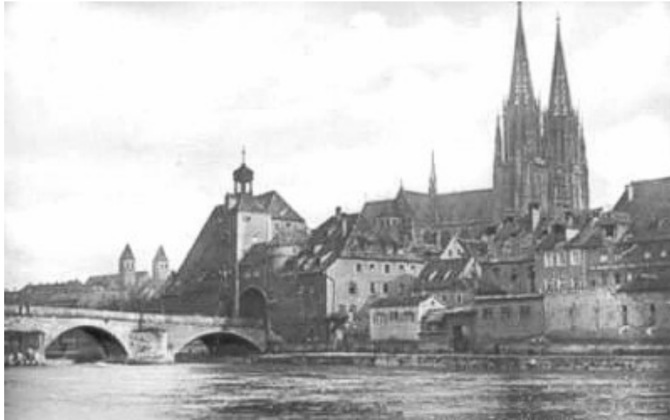
Postkarte von Regensburg mit Blick auf das Brücktor und den Dom, entstanden in den dreißiger Jahren